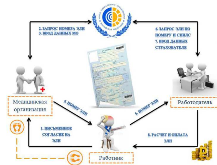
Схема получения ЭЛН